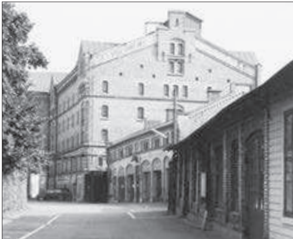
Gårdens östra sida. Verkstaden, stallet och "nya mälteriet".