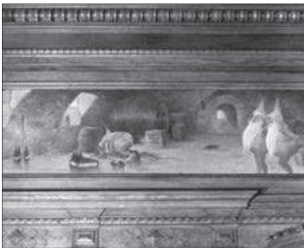
F d direktörsvillan, väggmålning med öldrickande tomtar.

Sydvästra hörnet upptas av "nya mälteriet" som har 5–6 våningar och är anläggningens mest monumentala byggnad. Med sina små fönstergluggar och utskjutande trappstegsgavlar liknar den en medeltida fästning. I denna del ingår också bryggeriets huvudentré som är en kraftig putsad portal med klocka över ingången.