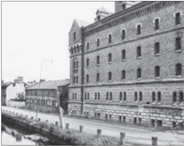
Fasader mot Mölndalsån. "Nya mälteriet", stallet och bostadshus för bryggeriarbetare.