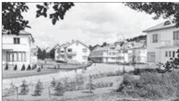
Skårsgatan cirka 1950.