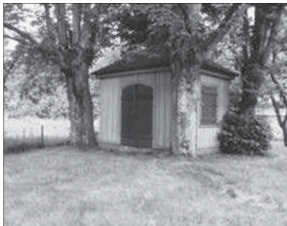
Skårs gård, lusthuset.

Den första industriella anläggning på denna plats var ett färgeri anlagt 1830. Det förändrades till textilfabrik av H Wesslau 1846 och anläggningen byggdes sedan ut i etapper. Omkring 1910 gjordes den sista större om- och tillbyggnaden och Almedals fabriker hörde i början av 1900-talet till Göteborgsområdets största textilföretag. Idag utgör tegelbyggnaderna och den delvis bevarade fabrikksskorstenen ett industrihistoriskt värdefullt inslag i miljön längs Mölndalsån. Anläggningen är också ett intressant komplement till "Lyckholms Bryggeri".