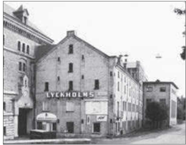
Fasader mot Skårs led. Entrén, "Gamla mälteriet" och bryggerhuset från 1950-talet.