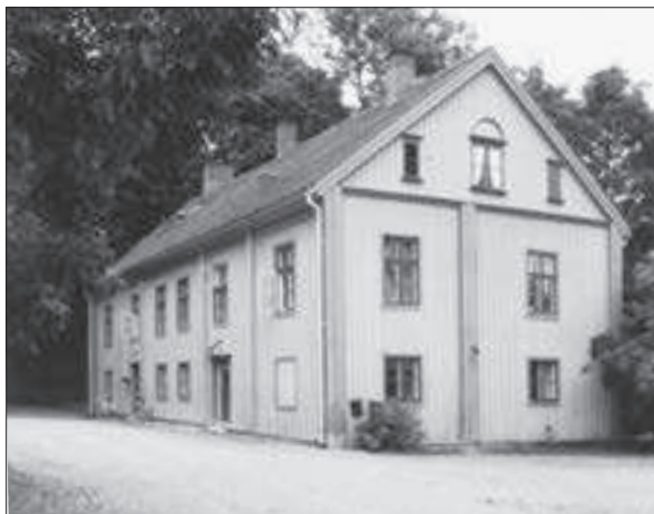
Skårs gård, huvudbyggnadens entréfasad.