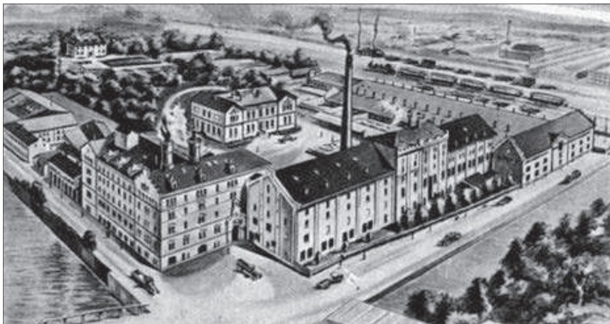
Lyckholms bryggeri 1931. I förgrunden nuvarande Skårs led. Större delen av byggnaderna finns kvar.